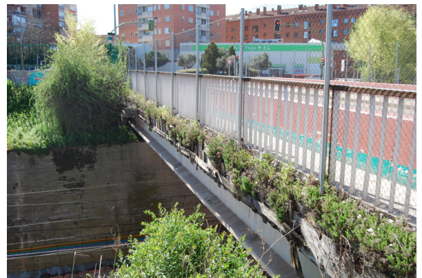
(b) Paso superior al que se adosa la pasarela.

The footbridge design constraints were highly determined by the presence of the railway line: reduce to the minimum possible those operations that affect the tracks, risk control during construction, minimize maintenance needs as much as possible (absence of elastomeric supports, ...); in short, propose a lasting, monolithic and rational structure.