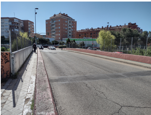
(a) Estrangulamiento de acera en calle Argentina.

Los condicionantes de diseño de la pasarela vinieron muy determinados por la presencia de la línea férrea: reducir al mínimo posible las operaciones que afecten a la vía, control de riesgos durante la construcción, minimizar al máximo las necesidades de mantenimiento (ausencia de apoyos elastoméricos,...); en resumen, plantear una estructura duradera, monolítica y racional.